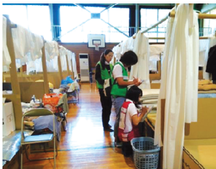
避難所巡回 (福祉的トリアージ)