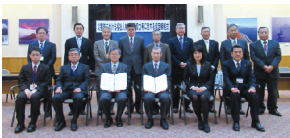
静岡県との「災害時における福祉人材の派遣協力等に関する協定締結式」(平成29年3月29日)

静岡DWATの派遣は、被災市町から静岡県を通じての派遣要請が原則となることから、派遣が円滑に行われることを目的に静岡県とネットワークの間で協定を締結しています。